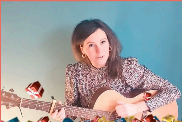
BODYPERCUSSIE 'Ik ben toch zeker sinterklaas niet'

Zin in een actief en creatief sinterklaas lesidee voor de bovenbouw? Luister en kijk naar de DEZE video. Oefen met de leerlingen de TEKST en gebruik DEZE link als backingtrack. Wil je een extra uitdaging? Laat een groepjes leerlingen deze bodypercussie erbij spelen.